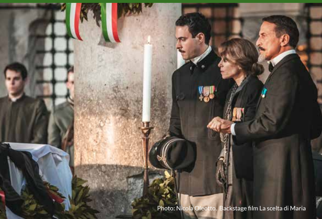
Backstage film La scelta di Maria