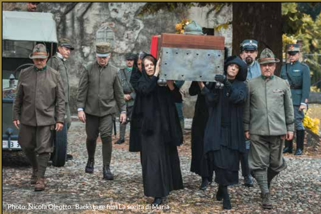
Backstage film La scelta di Maria

LE SPOGLIE FURONO TRASLATE NELLA BASILICA DI AQUILEIA IL 28 OTTOBRE E POSTE AI LATI DELL'ALTARE MAGGIORE (SEI DA UN LATO E CINQUE DALL'ALTRO), CIASCUNA AVVOLTA NEL TRICOLORE ITALIANO SU CUI POGGIAVA UN ELMETTO CINTO DA UN RAMOSCELLO D'ALLORO.